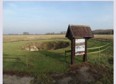
Karst-Erdfall im Distrikt Biržai, Litauen.

Andere Georisiken sind weniger dramatisch. So können Tonschichten anschwellen oder schrumpfen; durch Lösungs- und Einsturzvorgänge im Untergrund können Dolinen (Senkungstrichter) oder Erdfallschächte entstehen und dadurch Schäden an Gebäuden oder der Infrastruktur auslösen, ebenso wie instabiler Baugrund. Solche "leisen Risiken" fordern meist zwar kaum Menschenleben, können aber erhebliche wirtschaftliche Auswirkungen haben.