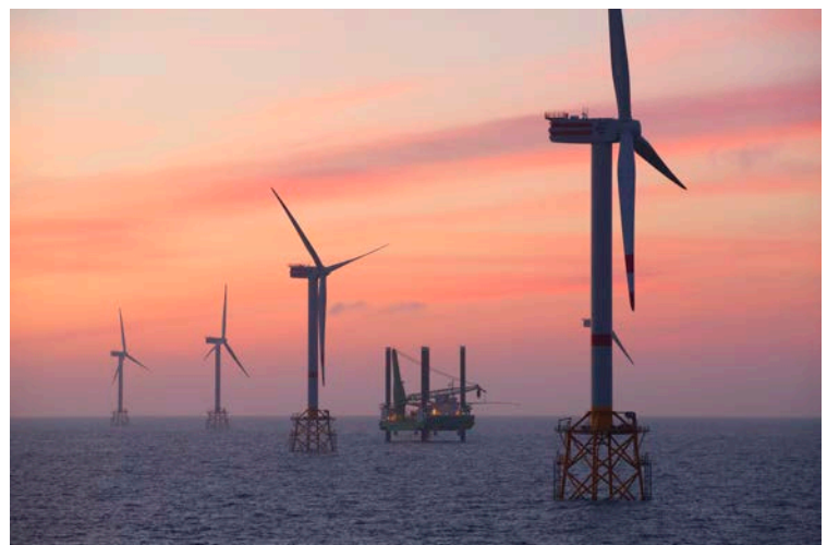
Windpark auf der Thornton-Bank, Belgien.

Geologische Endlagerung beinhaltet die Isolation von gefährlichen Reststoffen in unterirdischen Deponien. Dies muss in dafür geeigneten Gesteinsformationen erfolgen, typischerweise in Tiefen von 200 bis 1.000 m, so dass keine gefährlichen Mengen von Radioaktivität die Erdoberfläche erreichen können, auch nicht über das Grundwasser. Dabei kommt stets ein Mehr-Barrieren-System zum Einsatz, mit ummantelten Abfall-Containern, die in gebaute und später verfüllte Tunnel oder Kavernen eingelagert werden; die umgebenden Gesteine stellen eine zusätzliche geologische Barriere dar. Die Radionuklide sollen so für viele Jahrzehntausende eingeschlossen bleiben. Drei Gesteinstypen kommen hauptsächlich in Frage: Tonstein, Salzgestein und – wenn auch nicht bei uns - Granit, die ihre jeweiligen Eigenheiten, d. h. Vor- und Nachteile haben. Zwar wird bei der Standortsuche für Endlager die Akzeptanz seitens der Bevölkerung letztlich mitentscheidend sein. Doch vorher ist geowissenschaftliche Expertise zur Beantwortung zahlreicher Fragen unabdingbar.