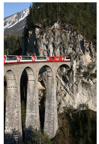
Der Glacier-Express auf dem Landwasser-Viadukt, Schweiz.

Wenn wir der Geosphäre als Teil unserer Umwelt immer mehr „Dienstleistungen“ für uns Menschen abverlangen, müssen wir diese sorgfältig planen. An jeden Teil des Untergrundes können unter Umständen verschiedene Nutzungsansprüche gestellt werden, in Konkurrenz oder nacheinander. Es mag zu Wettbewerb um den Untergrund kommen, für Ansprüche, die nicht miteinander kompatibel sind. Die Geowissenschaften können dabei wertvollen Rat geben; doch werden die Entscheidungen über die Nutzung unserer Geosphäre letztlich in der Politik und Wirtschaft getroffen.