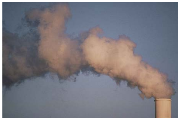
Luftverschmutzung: Rauch aus einem Fabrikschornstein.

Viele Forscher untersuchen das Ausmaß und die Verbreitung des menschengemachten Einflusses auf die Landnutzung und die Prozesse des Systems Erde und deren geologische