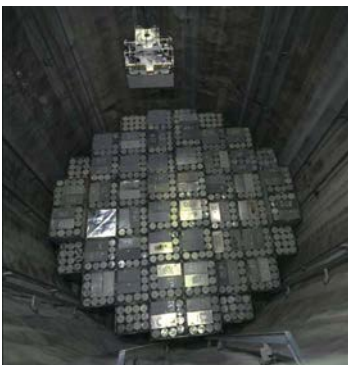
Schwach- und mittelradioaktiver Abfall; Endlager Olkiluoto, Finnland.

Fossile Brennstoffe werden zumindest in den nächsten Jahrzehnten auch in Deutschland als Teil des Energiemixes wichtig bleiben. Zwar sind die eigenen (momentan technisch verfügbaren) Reserven an Erdöl und Erdgas im Verhältnis zum derzeitigen Verbrauch im Land bescheiden, aber die Weiterentwicklung von Gewinnungstechniken für (potenzielle) Onshore- und Offshore-Ressourcen am Technologie-Standort Deutschland hängt auch vom geowissenschaftlichen Knowhow ab. Deutschland kann seine Abhängigkeit von Importen verringern und auch Arbeitsplätze sichern und neue generieren, wenn es die Chancen der Nutzung auch „unkonventioneller“ Vorkommen – stets nach den hohen deutschen Umweltstandards (!) – im eigenen Land wahrnimmt. Gas aus klassischen, großporigen Speichergesteinen, die aber oft nur eine geringe Durchlässigkeit aufweisen, dazu Schiefergas, Schieferöl und Kohleflözgas haben durchaus das Potenzial, einen wesentlichen Beitrag zum Energiemix zu leisten – wenn wir uns dazu entschließen, sie (möglichst umweltverträglich!) zu fördern. Wenn wir dies unterlassen, bleiben wir vermehrt importabhängig, politisch gefährdet und riskieren unsere Energiesicherheit.