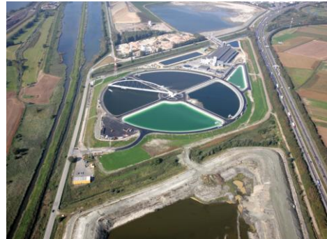
Sanierung belasteter Böden im Hafen von Antwerpen, Belgien.

Die Qualität von Boden und Wasser ist für eine sichere und dauerhafte Versorgung mit Nahrungsmitteln von großer Bedeutung. Der Boden wirkt darüber hinaus als wichtiger Speicher von atmosphärischem Kohlenstoff und trägt die Zeugnisse früherer und aktueller Klimaveränderungen in sich, wodurch er zu einem wichtigen Forschungsgegenstand für das Verständnis dieser Veränderungen geworden ist. Der Schutz und die Verbesserung der Flusssysteme, der Ozeane und des Trinkwassers hängen von der Kenntnis des Verhaltens und der gegenseitigen Beeinflussung von Wasser, Boden, Gestein und der Atmosphäre sowohl an der Oberfläche als auch im Untergrund ab.