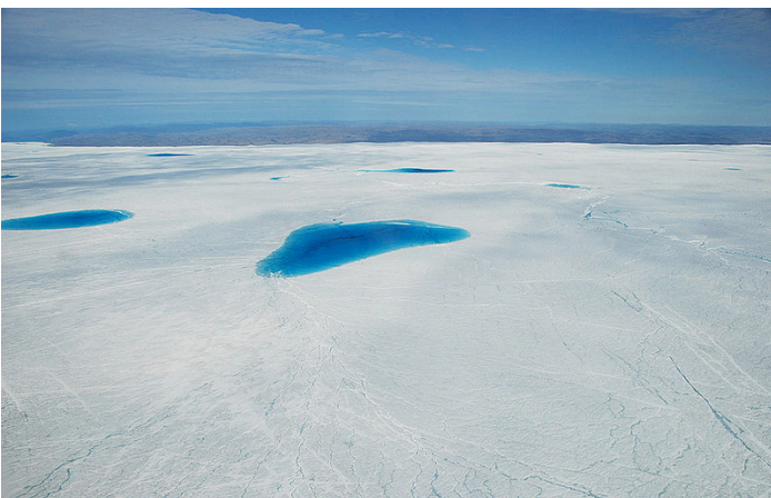
Schmelzwasserseen am Rand des grönländischen Eisschildes.

Die Spuren vergangener Klimaänderungen finden sich in einem breiten Spektrum geologischer Ablagerungen, wie Meeressedimenten, Ablagerungen in Seen, Eisschichten, fossilen Korallen, Tropfsteinen und fossilen Baumringen. Fortschritte bei den Feldbeobachtungen, den Labortechniken und in der numerischen Modellierung ermöglichen es den Geowissenschaften mit zunehmender Genauigkeit nachzuweisen, wie in der Vergangenheit die Klimaveränderungen abliefen. Die erworbenen grundlegenden Erkenntnisse über die Vergangenheit erlauben eine fundierte Abschätzung der möglichen Veränderungen in der Zukunft.