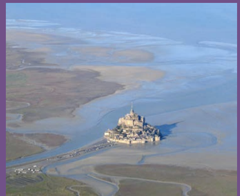
Mont Saint-Michel und seine Bucht; Normandie, Nord-Frankreich. UNESCO-Welterbestätte wegen seiner Bedeutung für Kultur und Landschaft.

Während die Sedimente durch die Gezeiten und Strömungen aus den Flussmündungen transportiert werden, führen sie Schadstoffe mit sich, die mit der Meerwasserchemie in Verbindung treten. Fischerei kann den Meeresboden schädigen und das Ökosystem zerstören. Maßnahmen zum Küstenschutz können das Ablagerungsverhalten der Sedimente verändern. Der Nährstoffkreislauf als eine der zusätzlichen Funktionen ist vom geochemischen Austausch zwischen verschiedenen Teilen des marinen/fluvialen Systems abhängig: von den Gesteinen, den auflagernden Sedimenten, der Lebewelt, der Wassersäule und der Atmosphäre.