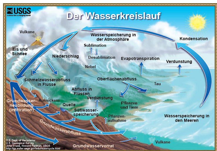
Der Wasserkreislauf.

Verunreinigungen können sich langsam vergrößern und sehr lange Verweilzeiten aufweisen, da die Fließbewegungen des Grundwassers sehr langsam und seine Filterwirkungen begrenzt sind. Sanierungen sind häufig sehr aufwändig und teuer, sowohl finanziell als auch im Energieverbrauch. Um solche Kosten zu minimieren und wieder sauberes Wasser zu erhalten, ist geowissenschaftliches Verständnis vom Aufbau des Untergrundes, Verhalten des Grundwassers und der geochemischen Prozesse und Kreisläufe der Verschmutzungstoffe gefragt.