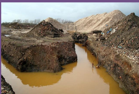
Beseitigung chemischer Abfälle; Wakefield, England.

Sanierungsmaßnahmen und die Handhabung kontaminierter Flächen können aufwändig und teuer sein, besonders wenn es sich um wilde Ablagerungen und giftige Stoffe handelt. Geochemische Untersuchungen zeigen die Komplexität industrieller Bodenverunreinigungen, helfen aber auch, bessere Techniken zu entwickeln, den Verunreinigungen zu begegnen. Eine nachhaltige Sanierung kontaminierter Flächen in Europa erfordert innovative Ansätze auf Ingenieur- wie auf Managementseite zur sicheren Lagerung kontaminierter Materialien, fußend auf guten Kenntnissen des geologischen Untergrundes.