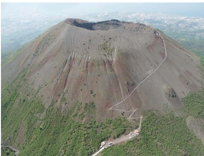
Der Vulkan Vesuv bei Neapel, Italien.

Es sollten alle Anstrengungen unternommen werden, um die Opferzahlen bei Vulkanausbrüchen zu minimieren. Dabei ist die Zahl der Verluste an Menschenleben durch