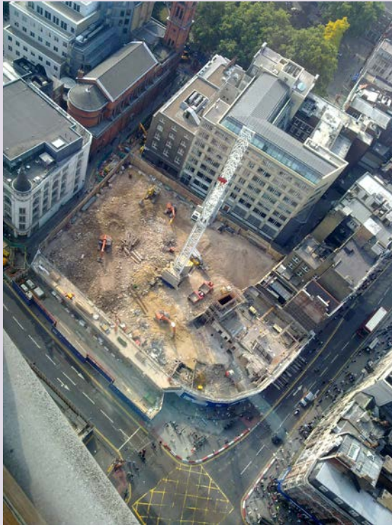
Baustelle des Crossrail-Bahnverkehrsprojektes an der Station Tottenham Court Road; London.

Immer mehr Menschen leben in großen bis extrem großen und komplexen Städten. Die Mitarbeit von Geowissenschaftlern am Management der vielfältigen und oft konkurrierenden Nutzungen der Oberfläche und des Untergrundes wird in jedem Fall vermehrt wichtig sein, insbesondere wenn die Städte der Zukunft nachhaltiger sein sollen.