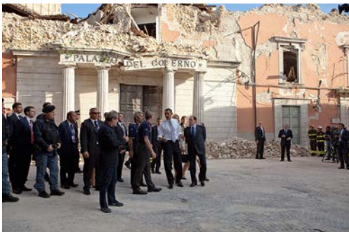
US-Präsident Barack Obama bei seinem Besuch in L'Aquila, Italien, nach dem Erdbeben 2009.

In vielen Teilen Europas haben sich bisher nur Erdbeben geringerer Stärke ereignet, jedoch sind weltweit gesehen die Gefahren durch Erdbeben für den internationalen Handel und die Entwicklungshilfe beträchtlich.