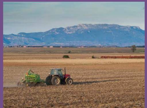
Landwirtschaft in der Provinz La Rioja, Nordost-Spanien.

Der global große Bedarf an Düngemitteln hat zu großer Nachfrage geführt und zu beträchtlicher Besorgnis über die zukünftig sichere Versorgung mit Phosphat und Kali. Nur wenige Länder beliefern den Weltmarkt mit Phosphat, hauptsächlich China. Aber – anders als beim Kali – zieht die ständige Verwendung von Phosphor Umweltschäden nach sich, weil Phosphat vom Regen in die Gewässer ausgewaschen wird und dort Eutrophierung zur Folge hat.