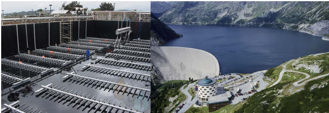
Abwasserbehandlungssystem und Kölnbrein-Sperre und Pumpspeicher-Kraftwerk; Kärnten, Österreich.

Das Verständnis der regionalen und lokalen hydrogeologischen Situationen und Umweltbedingungen ist essenziell für die Gewährleistung der Wasserversorgung und -qualität. Hydrogeologen und -geochemiker untersuchen und kartieren den Untergrund, um die Bewegungen und chemischen Veränderungen des Grundwassers zu verstehen, zu modellieren und die Grundwasserressourcen zu charakterisieren. Saisonales und langfristiges Monitoring des Grundwassers kann helfen, auch in Zukunft die Versorgung mit ausreichend sauberem Grundwasser zu gewährleisten. Diese Informationen werden dann genutzt, um strategische Pläne zur Versorgungssicherheit zu entwickeln.