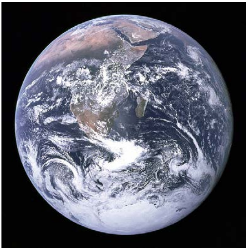
Die Erde aus Sicht der Crew von Apollo 17.

Die Geowissenschaften befassen sich mit dem Aufbau und der Geschichte der Erde. Sie tragen zur Versorgung der Bevölkerung und Industrie mit Rohstoffen bei, stellen viele grundlegende Dienstleistungen zur Verfügung und fördern das Verständnis, wie wir auf unserem Planeten nachhaltiger leben können; und all dies auf der Basis von solider Ausbildung, professionellen Fähigkeiten und intensiven Forschungen.